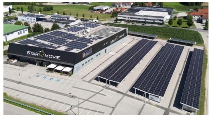
Die PV-Carportanlage von Star Movie Tumeltsham produziert rund 530.000 Kilowattstunden Strom pro Jahr.

Das Investment nur in Photovoltaik am Star Movie Standort in Tumeltsham beläuft sich nun auf rund EUR 900.000,00 Euro (= Summe aus Dach-PV-Anlage und PV-Carports).